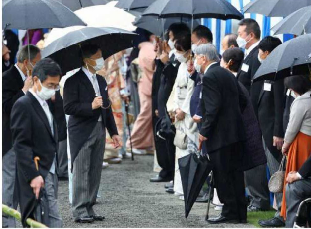
4年半ぶりに開かれた園遊会に臨まれる天皇陛下=東京都港区の赤坂御苑で2023年5月11日午後2時51分